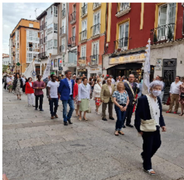
Grupo ARPU en procesión del "Corpus Christi" en Burgos (19-6-2022)

4ª.- La ARPU tiene algunas fiestas y celebraciones de la Iglesia como más propias.